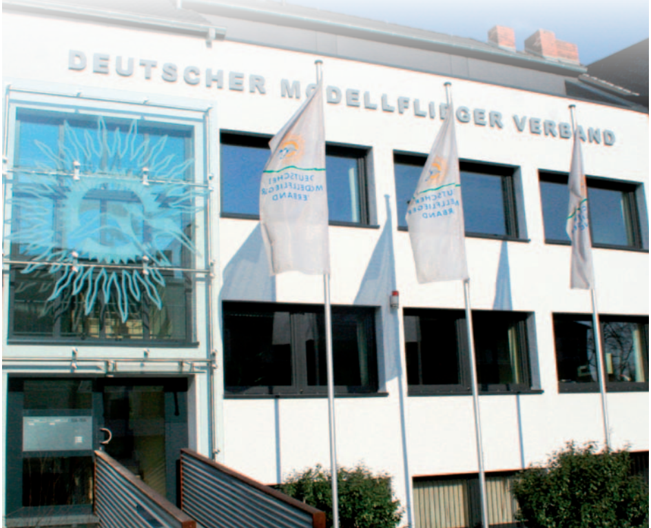
Das „Haus des Modellflugs“ in Bonn

Der DMFV ist die erste Anlaufstelle der Modellflieger und verfolgt lediglich Ziele, die im Interesse der Modellflieger und der Modellflugvereine liegen. Modellflug ist Sport, Wissenschaft, Technik, Freizeit und Hobby für alle Altersgruppen. Jährliche Zuwachsraten sind ein Indiz für die steigende Attraktivität des Modellflugs auf der Grundlage eines kompletten Dienstleistungsangebotes des DMFV. Dafür setzen sich DMFV-Präsidium, DMFV-Ehrenamtsträger in Sport- und Gebietsbeirat sowie alle Mitarbeiterinnen und Mitarbeiter in der DMFV-Geschäftsstelle gleichermaßen ein.