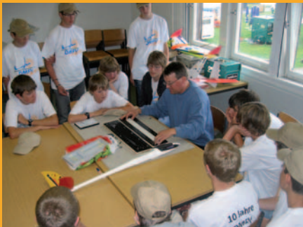
DMFV-Bastelworkshop für Jugendliche